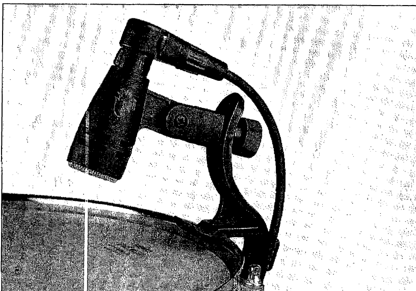
La pince de fixation illustrée ici n'est pas incluse.

Microphone de percussion cardioïde, bobine de compensation du ronflement, bande passante 40 - 18000 Hz, facteur de transmission à vide (à 1 kHz) 1,8 mV/Pa ± 3 dB, impédance nominale 350 Ω, impédance mini. de charge 1000 Ω, dimensions Ø 33 x 59 mm, poids 60 g.